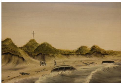
Stranden efter forlis i 1893. Maleriet er malt af Anders Melchiorsen.