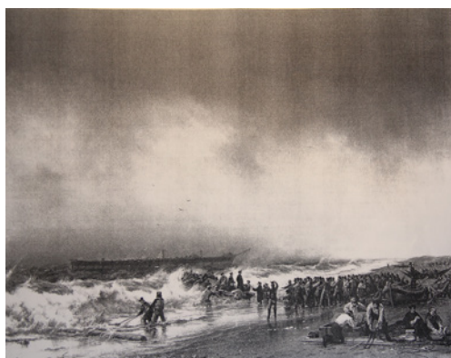
Fregatten "Alexander Newsky", Harboøre, 1868. Efter maleri af den russiske maler, Alexej Bogobiubov. (Studie til maleriet gjort på Harboøre i november 1868).