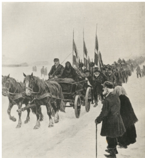
Redningsbåden "Lilleøres" forlis i 1897. Ligtøget kører fra Vejlbj by til Harboøre Kirkegård.