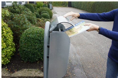
Hovedparten af Hardsyssel Historisk Samfunds medlemmer får årbogen via privat omdeling. På den måde sparer foreningen mange udgifter til porto.