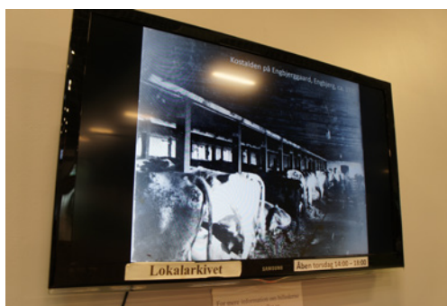
Arkivet har ca. 20.000 registrerede fotos og det samme antal, der endnu ikke er registrerede. På en skærm uden for arkivets lokaler og synligt for alle i Harboøre Centeret vises der konstant et udpluk af arkivets fotos.

Januar 1897: Redningsbåden "Lilleøre" kæntrer i forsøget på at assistere fiskerbåde, der var i knibe ud for Harboøre Sogn. 12 redningsmænd druknede. De efterlod sig 10 enker og 26 ukonfirmerede børn.