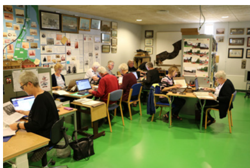
En del af arkivets mange frivillige i arbejde.