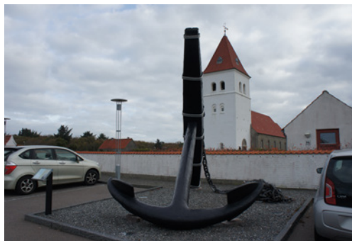
Lokalarkivet er i den grad også synligt uden for sin egen matrikel. Arkivet har været med til at finansiere flytning og opstilling af et af ankrene fra "Alexander Newsky", der nu står foran Harboøre Kirke.