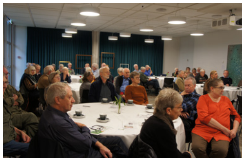
Der var ca. 60 deltagere i Historiens Dag, der foregik i Holstebro Museums nye foredragssal. Her er et udsnit af forsamlingen.

Hardsyssel Historisk Samfund udsender med jævne mellemrum et elektronisk nyhedsbrev til vores medlemmer med stort og småt om arrangementer, hvad bestyrelsen har gang i, og hvad du som medlem kan forvente og glæde dig til.