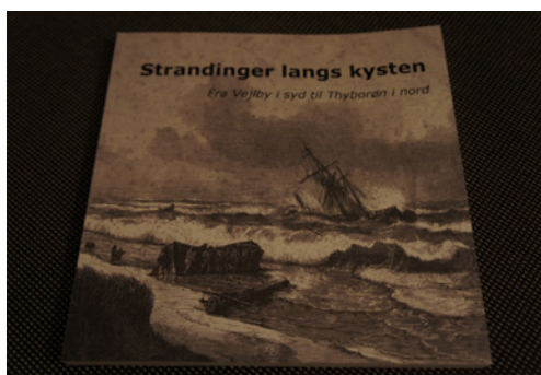
Lokalarkivet udgiver med jævne mellemrum bøger. Den seneste fra 2021 handler om strandinger langs kysten fra Vejlbj by i syd til Thyborøn i nord.