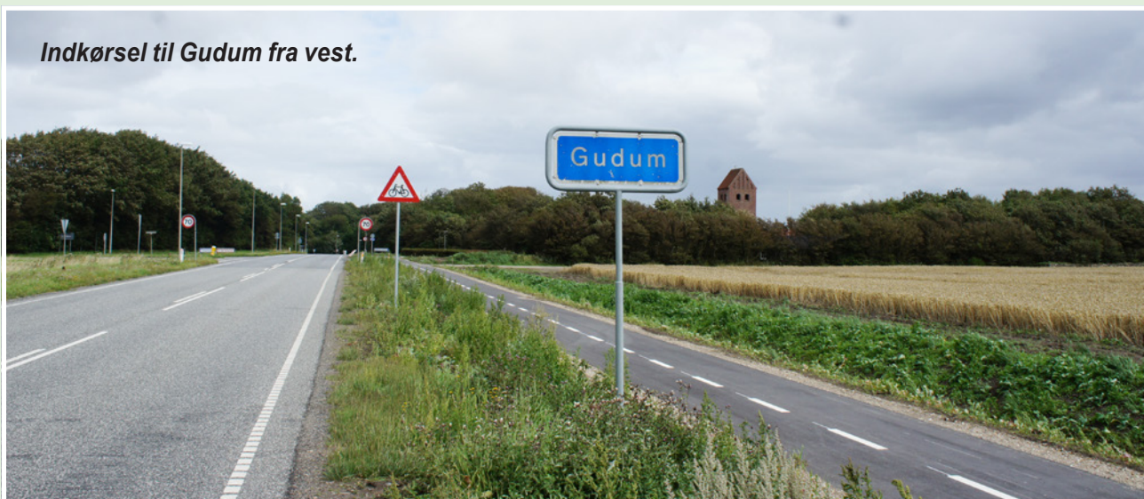
Indkørsel til Gudum fra vest.