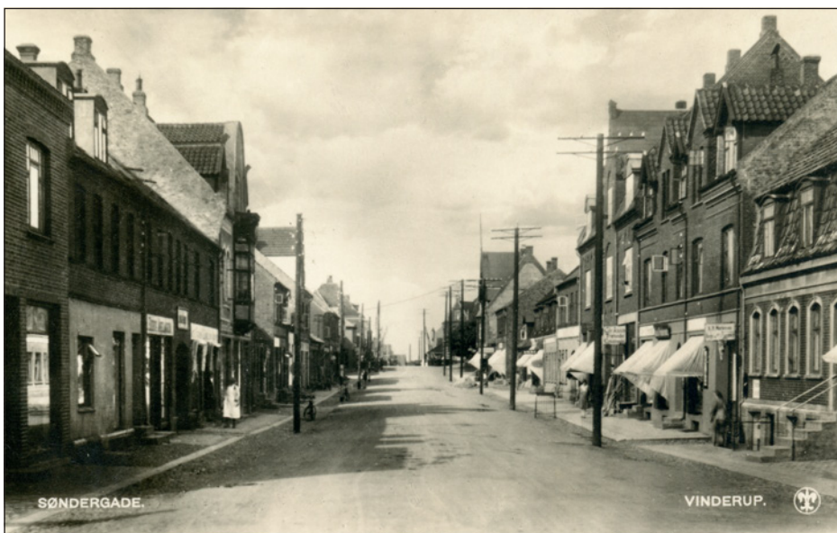
Søndergade i Vinderup ca. 1930. Udviklingen i stationsbyen har taget fart.