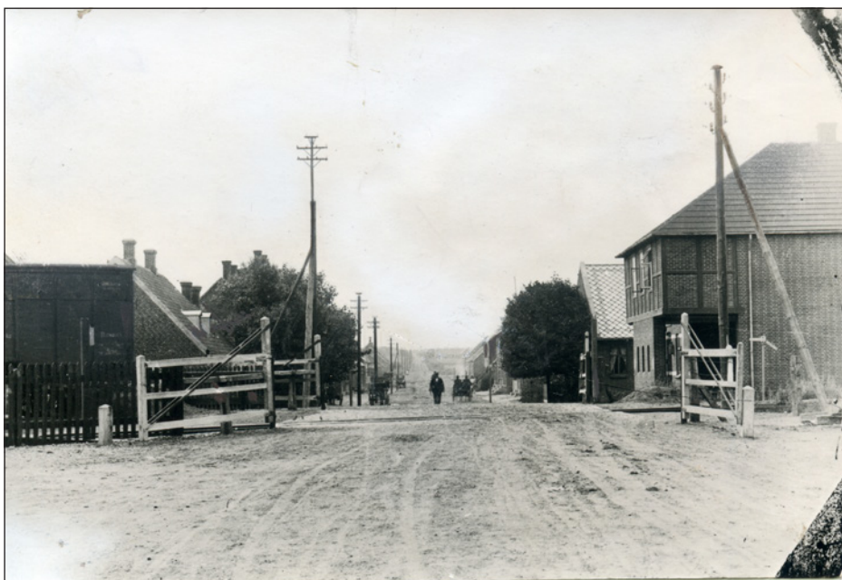
Søndergade i Vinderup ca. 1910, set fra jernbanen, der blev indviet i 1865.