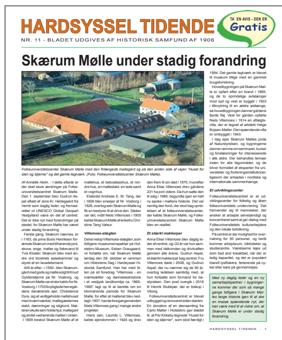
På forsiden af Hardsyssel Tidende nr. 11 er der en artikel om Skærum Mølle ved Vemb.