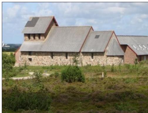
Hellig Kors Kloster er ramme om Historisk Samfunds sommermøde den 24. august.

Hardsyssel Historisk Samfund udsender med jævne mellemrum et elektronisk nyhedsbrev til vores medlemmer med stort og småt om arrangementer, hvad bestyrelsen har gang i, og hvad du som medlem kan forvente og glæde dig til.