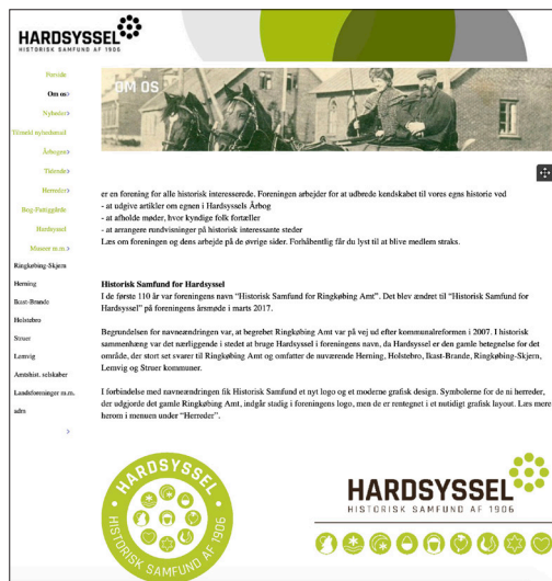
Forsiden af Hardsyssel Historisk Samfunds hjemmeside med bl.a. menupunktet »Museer m.m.«