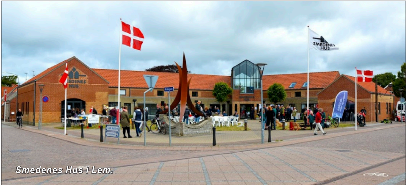
Smedenens Hus i Lem.

Hardsyssel Historisk Samfund udsender med jævne mellemrum et elektronisk nyhedsbrev til vores medlemmer med stort og småt om arrangementer, hvad bestyrelsen har gang i, og hvad du som medlem kan forvente og glæde dig til.